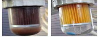
ストレーナー洗浄前(左)、洗浄後(右) ※上記画像はストレーナー交換した場合です。